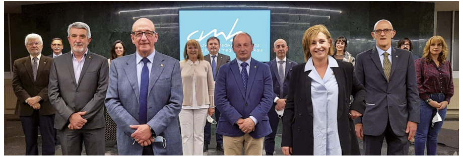
Colegio de Médicos de Bizkaia · Bizkaiko Medikuen Elkargoa

Con este reconocimiento, que tiene como objetivo premiar a aquellas personas y organi-